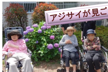
アジサイが見ごろでした