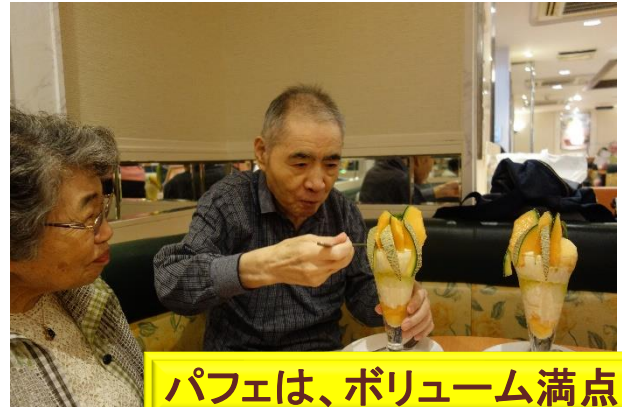
パフェは、ボリューム満点

6月8日 ファミリーレストランに散歩しながらお出かけしました。当日は、梅雨の晴れ間で天気が良く、とても暑い日でした。みなさん、じっくり選んで注文して、楽しんで召し上がっていました。