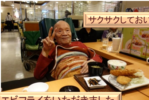
サクサクしておいしい