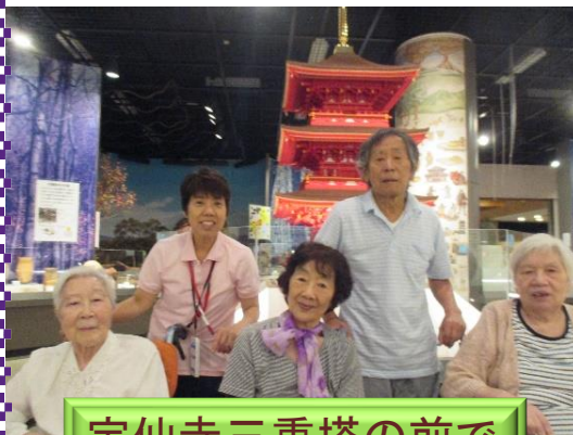
宝仙寺三重塔の前で

6月26・27日 中野区歴史民俗資料館 「絵葉書にみる東京・中野」展に出かけました。みなさん、中野の昔を再現した資料や模型を見て、懐かしく思い出を語ってくださいました。