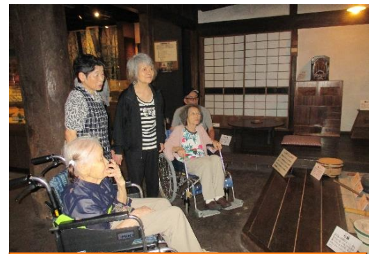
かまどでご飯を炊いたわねー