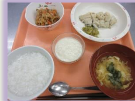
全粥 / 刻み