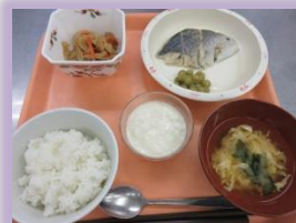
全飯 / 形

ご利用者お一人おひとりに合わせた食事形態やアレルギーなど個別に対応いたします。定期的な選択食や行事食を実施しております。