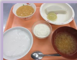
粥ペースト/ペースト